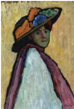
Gabriele Münter Bildnis Marianne von Werefkin, 1909.