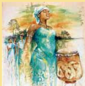
Sri Irodikromo © WGT - Dt. Komitee e.V.

Diavortrag zur Vorbereitung des Weltgebetstags