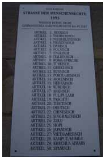
Straße der Menschenrechte Germanisches Nationalmuseum Nürnberg - privat

In Kooperation mit Campo Limpo, Solidarität mit Brasilien e.V.