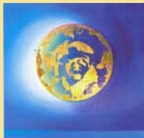
...um die Erde Lebenswind

Anmeldung bis 10.5. bei der Verantwortlichen