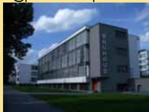
Gropius, Bauhaus Werkstatt-Gebäude Dessau 1925-26, Foto privat