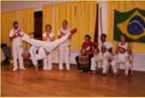
Capoeira (Kampftanzgruppe) beim Brasilianischen Abend

christlichen Alltag mehr als Liturgie, Dogmatik und Kirchenrecht. Es ging um die Konkretisierung aller Lehre und allen theologischen Überbaus. Befreiungstheologie erzeugte ein Gespür für weltweite Verantwortlichkeit, für solidarische Hilfe und für direkte Begegnung. Campo Limpo ist ein Projekt aus dieser Zeit.