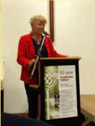
Prof. Dr. Gesine Schwan: Vortrag: Zukunft haben wir nur gemeinsam