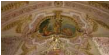
Holzhausen, Heilig Kreuz Kirche