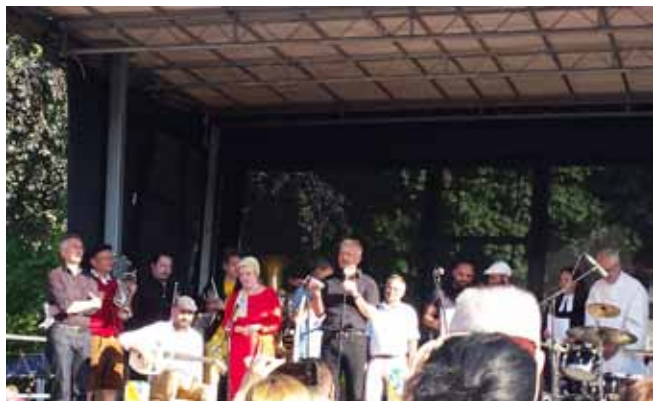
7.7.2019 Fest der Kulturen „Puchheim ist bunt“ Interkulturelles Friedensritual